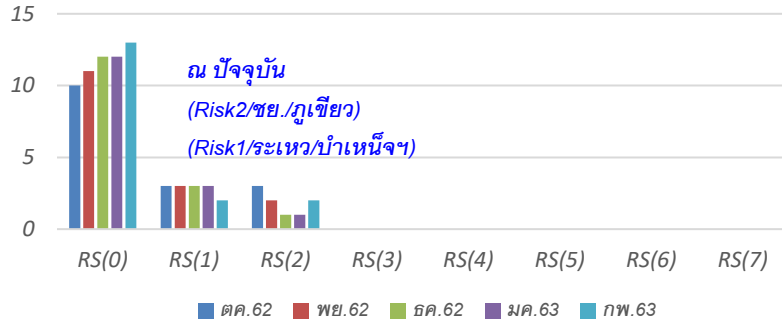
แนวโน้ม Risk Score 5 เดือน