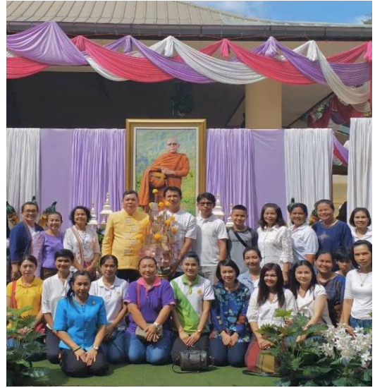
กิจกรรมทำบุญนอกสถานที่ตาม เทศกาลต่าง ๆ