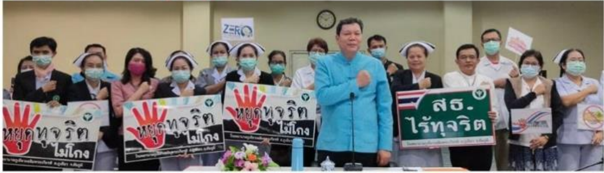
หน้าแรก ITA 2562 ITA 2563 ITA 2564 ITA 2565 ติดต่อเรา