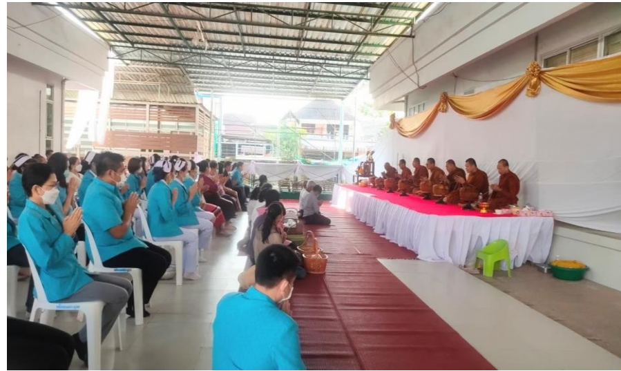
งานทำบุญประจำปีร่วมกับชุมชน